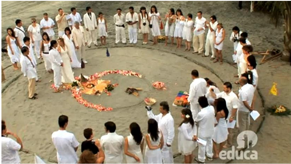
Imagen tomada de: Video “Vínculos con nuestro pasado” – Programa “Ecuador, somos así”

Imagen tomada de: Video “Ancestralidad” – Programa “Ecuador, somos así”