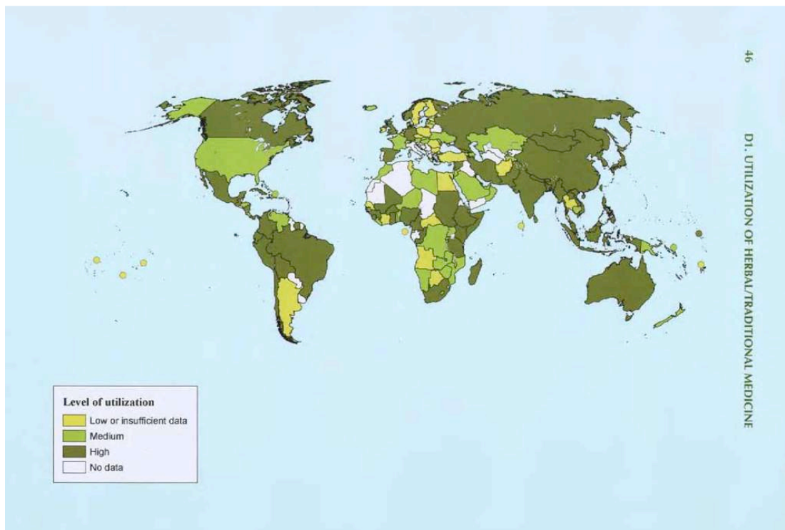
Figura 1. Uso de plantas y medicina tradicional

En el Ecuador la población hace un amplio uso de las terapias tradicionales, especialmente en aquel basado en hierbas medicinales. De acuerdo al mapa de utilización de medicina tradicional/hierbas medicinales confeccionado por la OMS, Ecuador está entre los países con uso “alto” (Figura 1.1).