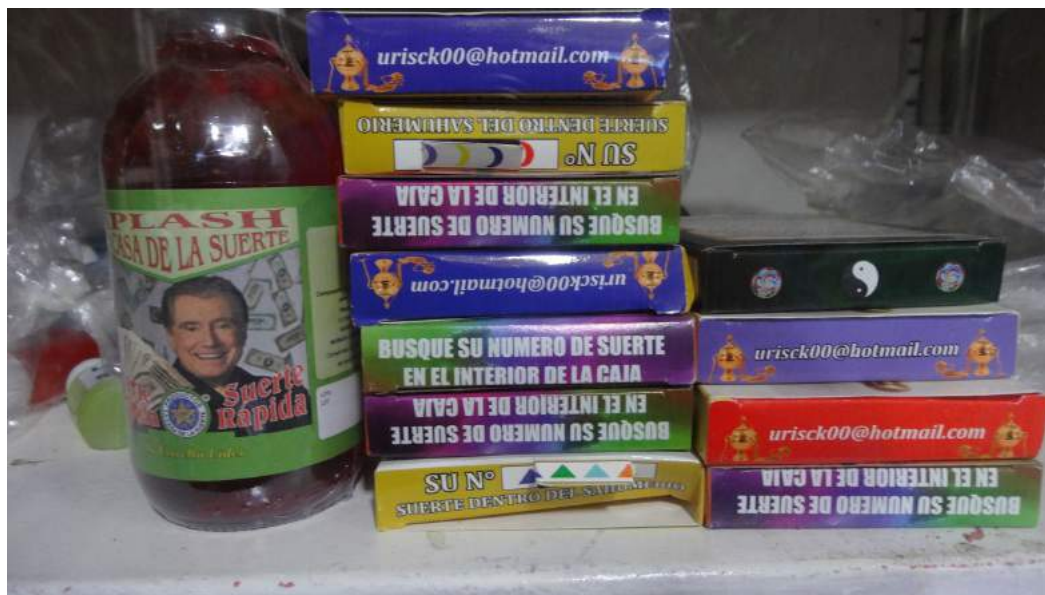
Productos esotéricos en los puestos de las hierbas.

efectos que surgen cuando hay una interculturalidad en salud en el país que excluye a una medicina que tiene sus características que se forjan en un encuentro entre lo rural y lo urbano.