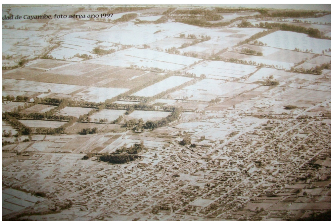
Imagen 1. Ciudad de Cayambe, foto aérea año 1997