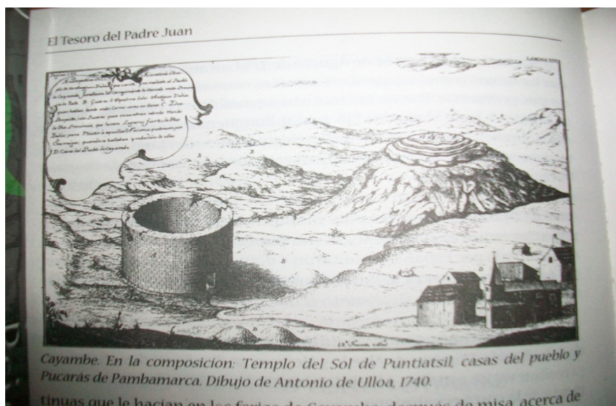
Imagen 3: Templo del Sol de Puntiatzil, casa del pueblo y Pucarás de Pambamarca. Dibujo de Antonio de Ulloa. 1740.