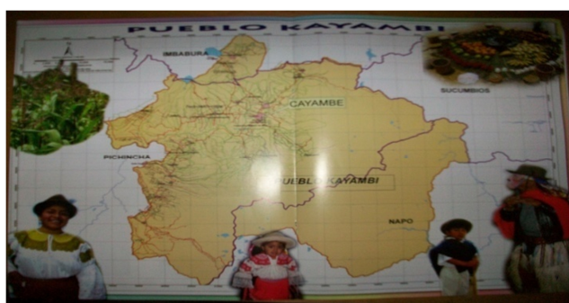
Imagen 4. Mapa de ubicación de las comunidades que abarca la Organización del Pueblo Kayambi.