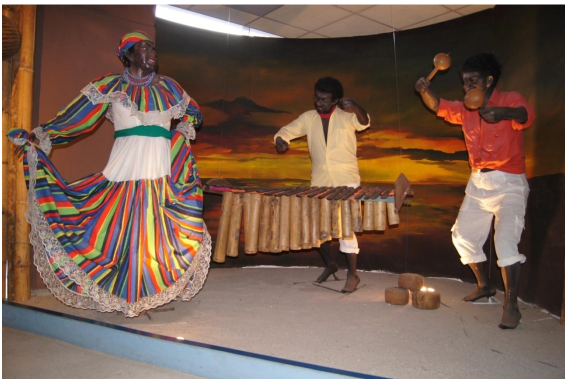
Representación del afroecuatoriano.