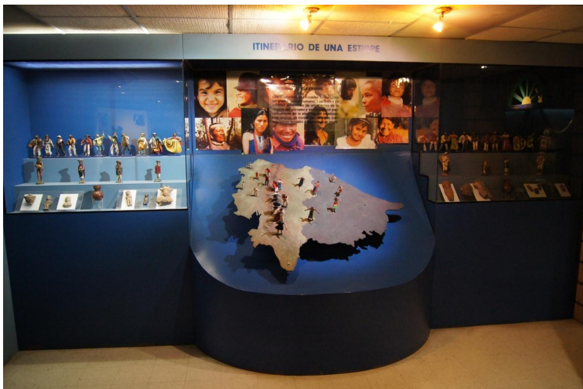
(Vitrina que explica la diversidad humana en Ecuador con mapa desactualizado)

A la cédula antes citada acompaña un mapa del Ecuador desactualizado que conserva el territorio amazónico que quedó fuera de las fronteras nacionales después del acuerdo de paz firmado el 26 de Octubre de 1998 por los ex presidentes de Ecuador, Yamil Mahuad, y del Perú, Alberto Fujimori, en la denominada "Acta de Brasilia", por lo que desde la constitución de la república hasta la actualidad, la representación del país a través del mapa sigue siendo un imaginario todavía en construcción.