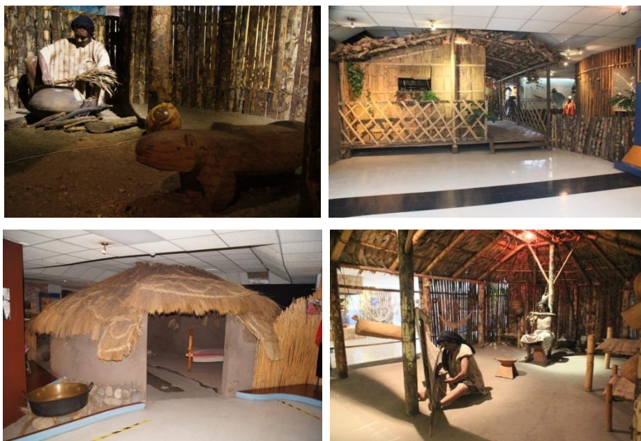
(En el orden del recorrido: casas shuar, montubia, chimbo, achuar).

El hecho no solo de reproducir las casas, sino de hacerlo con los materiales originales, y por personas nativas, demuestra la intención de lograr la autenticidad máxima: las casas son totalmente reales, son auténticas. Se pone en escena el aura del objeto original de Benjamin. Que las cuatro casas estén ubicadas estratégicamente de forma que sea necesario ingresar en ellas durante el recorrido, persigue el propósito de que el visitante viva la experiencia de trasladarse al territorio original; de estar allí. El haber acordado con personas nativas la reproducción de las viviendas es sin embargo uno de los pocos ejemplos de puentes de diálogo que el museo tendió con los sujetos que serían representados.