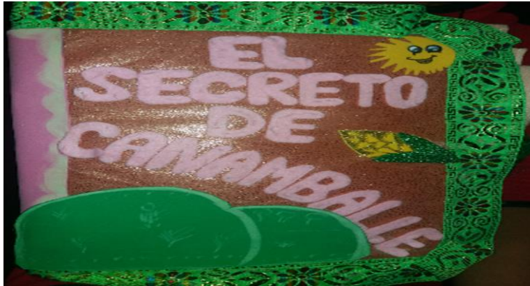
Fotografía tomada por Lucy Bonilla, (2018)