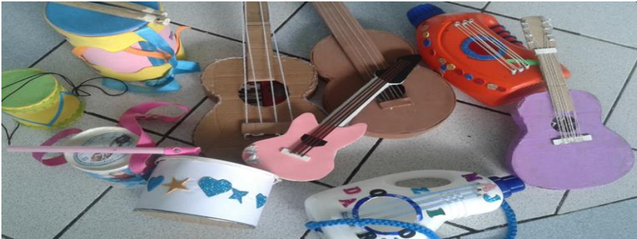
Fotografía tomada por Lucy Bonilla, (2018)