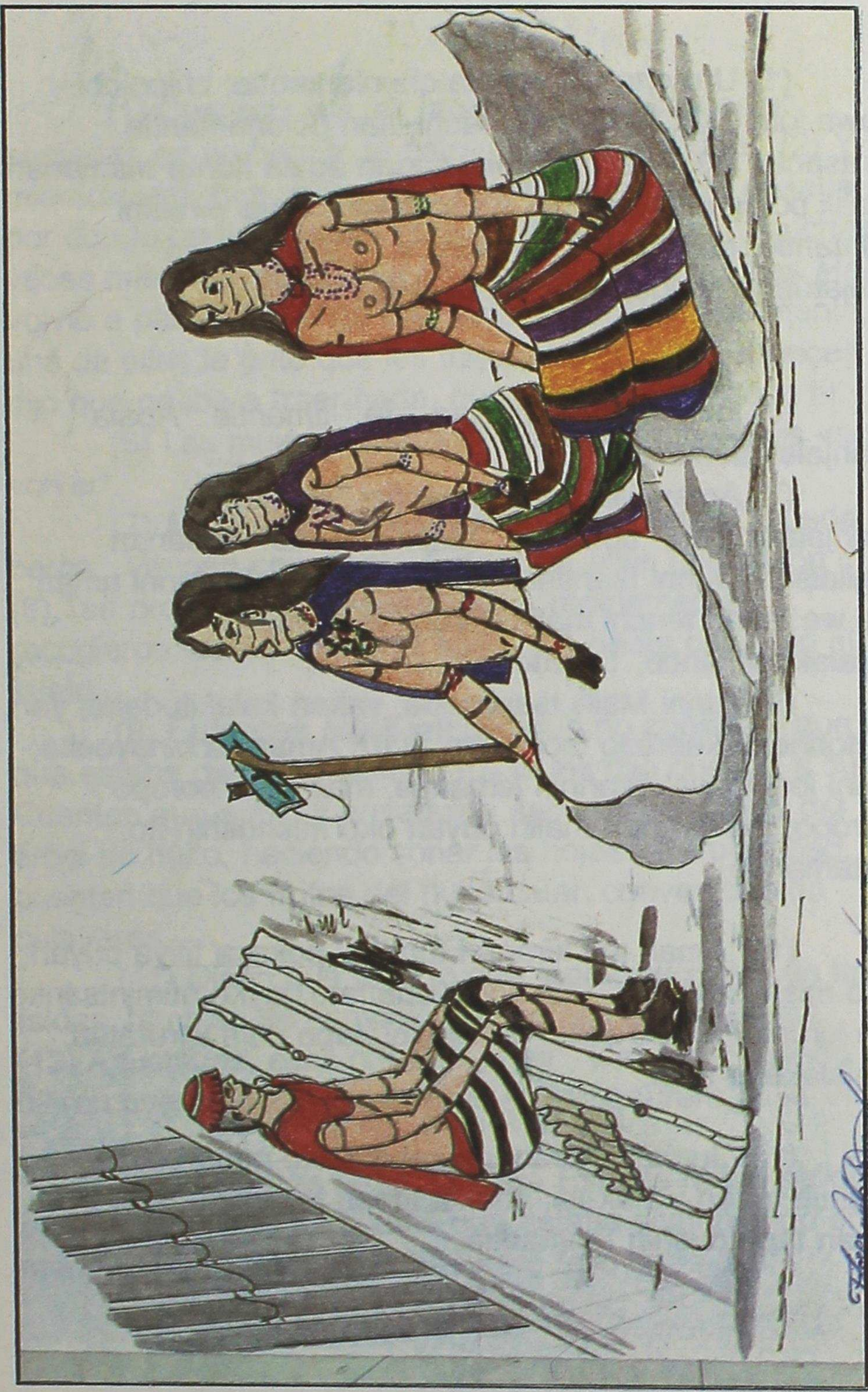
...junte kuwenta kito chuminan