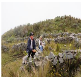
IMAGEN N° 2: Restos yacimientos en Quitoloma